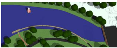
Nieuwe aanlegplaatsen Breda

Met Rijkswaterstaat heeft het regioteam regelmatig overleg over nieuwe ontwikkelingen en knelpunten. Met oog voor de belangen van alle partijen, beroepsvaart, recreatievaart en de vaarwegbeheerders, komen we vaak tot een gezamenlijke oplossing.