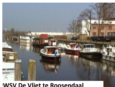
WSV De Vliet te Roosendaal

In 2016 waren er bij enkele verenigingen nog steeds de verhuizingen aan de orde, al is er wel de nodige voortgang gemaakt. Dit blijft ook in 2017 een aandachtspunt. Discussies met gemeenten zijn regelmatig aan de orde, veelal komen er oplossingen, soms na een serieuze briefwisseling. Soms zijn de problemen meer weerbarstig, zoals de wachtplaatsen voor de beroepsvaart nabij de watersportvereniging in Gorinchem. Samen